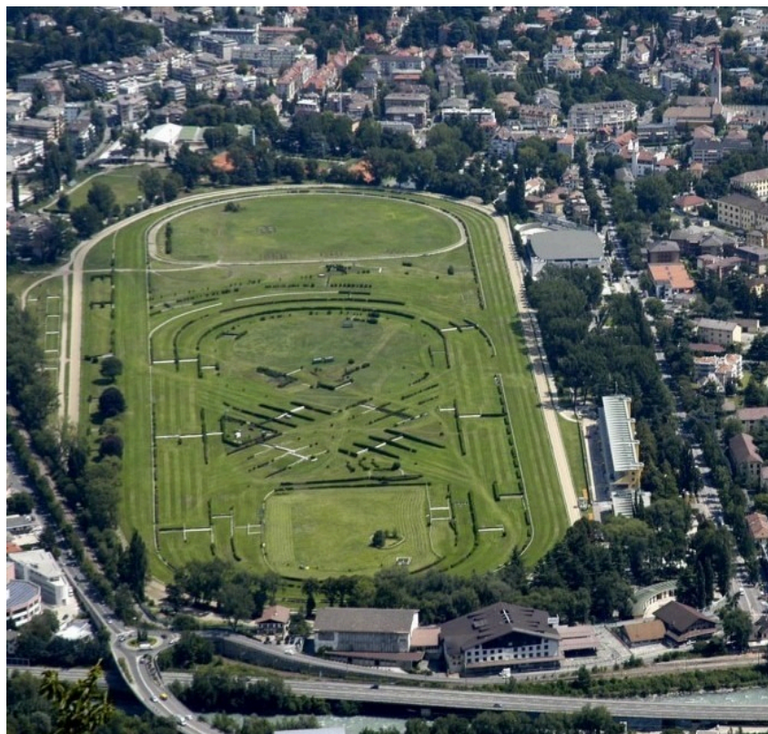
Vista dell'Ippodromo di Merano e di parte della città